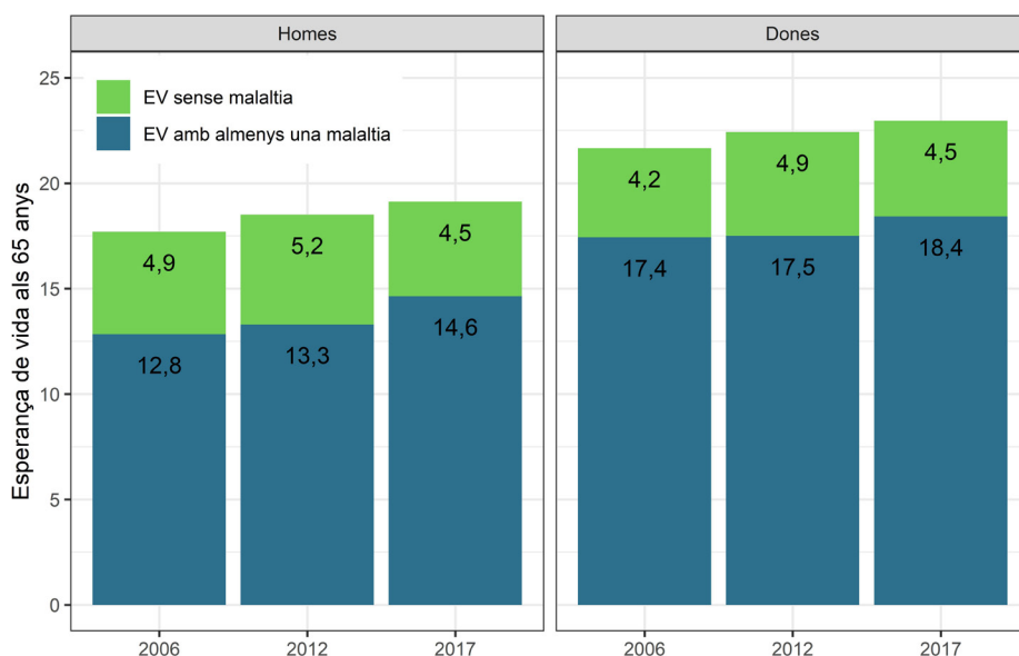
FIGURA 1. Evolució de l'esperança de vida als 65 anys i dels anys viscuts amb i sense malaltia

L'esperança de vida a Espanya està actualment entre les més altes del món amb 80,9 anys pels homes i 86,2 anys per les dones al 2019. Aquest creixement positiu s'ha observat sense interrupcions des de la dècada dels 70 del segle passat. Cal preguntar-se, però, si aquests guanys de vida han estat també en bona salut, especialment entre les persones més grans. Segons les dades de l'Institut Nacional d'Estadística (INE), l'esperança de vida en bona salut al néixer ha augmentat durant els darrers 15 anys. En canvi, els anys viscuts en bona salut a partir dels 65 anys, s'han mantingut força estables malgrat el creixement en l'esperança de vida (INE, 2020). La mesura més comuna per definir bona salut es basa en l'absència de limitacions funcionals o discapacitats. Amb tot, és important saber què passa amb altres indicadors de salut, com per exemple, conèixer quant de temps de les nostres vides passarem amb malalties